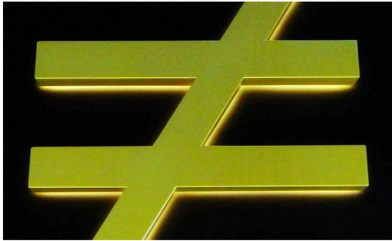
PSJM (2014) 'Desigualdad'

...un grupo de personas hambrientas y olvidadas esperan a la nada en un paisaje rural estadounidense: un niño africano desnutrido, un hombre de traje y con chistera —con los pantalones bajados y las nalgas en la parte delantera del cuerpo— y una mujer parcheada conduciendo un coche decrepito son alguno de los personajes de una comitiva decadente que versiona el cuadro del mismo título que pintó en el siglo XVI el artista alemán del renacimiento Hans Holbein el Joven (1497-1543).(2013, s/p)