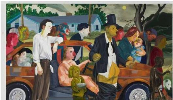
El triunfo de la pobreza´ (2009)

A continuación, se muestran dos obras de las artes plásticas y visuales que representan lo explicado, resaltando que, aunque no son hechas por artistas latinoamericanos, ni especifican un lugar de esta región, si expresan la problemática a destacar en este estudio que es la Desigualdad social .