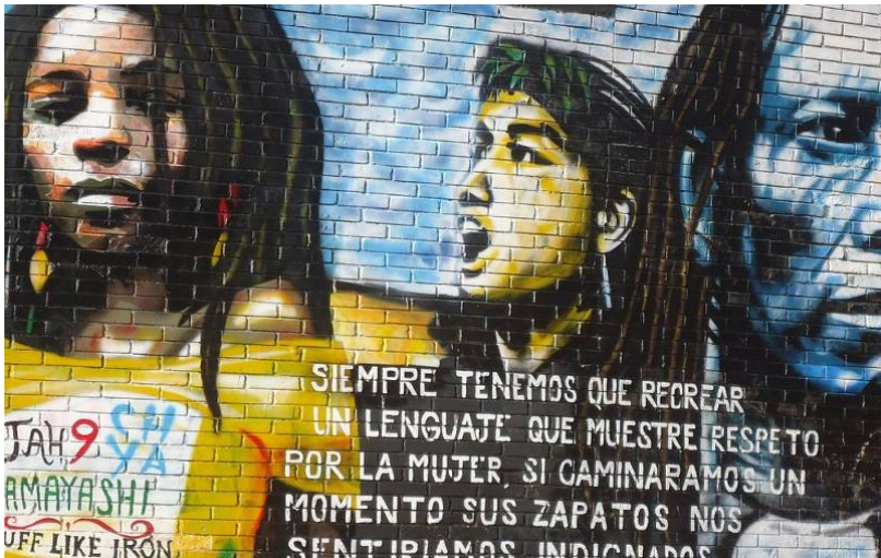
Raza y clase social también influyen en una mayor desigualdad de género.

En el resto de América Latina países como Brasil, Venezuela, han desarrollado en los últimos tiempos este tipo de modalidad artística que, valiéndose de técnicas y recursos propios, transmite mensajes, destacándose los referidos a las desigualdades sociales, que buscan suscitar un impacto y transformación cultural en el público que lo observa, y en la sociedad en general.