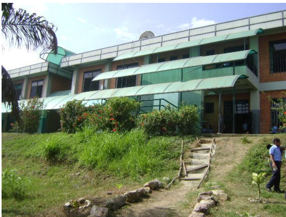
E.T. “Samuel Robinson” Salinas Sur – Puerto Cabello

Con la ejecución de cada una de las actividades reflejadas en el plan de acción, se le dará respuestas de forma práctica a las problemáticas existente en la E.T. “Samuel Robinson” Salina Sur, planteadas en la presente investigación, es así que a continuación se hace referencia a cada una de las actividades previstas y no previstas para la misma.