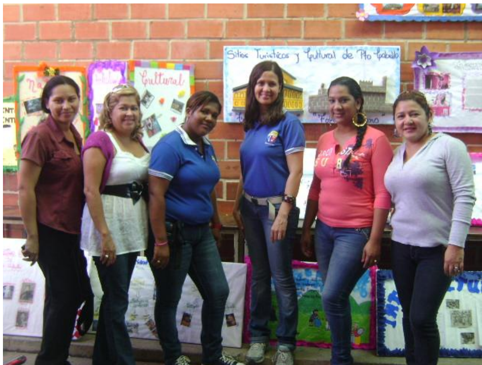
GRUPO DE DISCUSIÓN

Análisis: Después de discutir la problemática cultural e intercultural de la escuela, los docentes y la investigadora coincidieron que era relevante realizar un plan de acción con estrategias y actividades que contribuyan a mejorar dicha problemática y promover a la escuela como espacio para la promoción de la interculturalidad en la praxis educativa, social y su proyección al entorno comunitario.