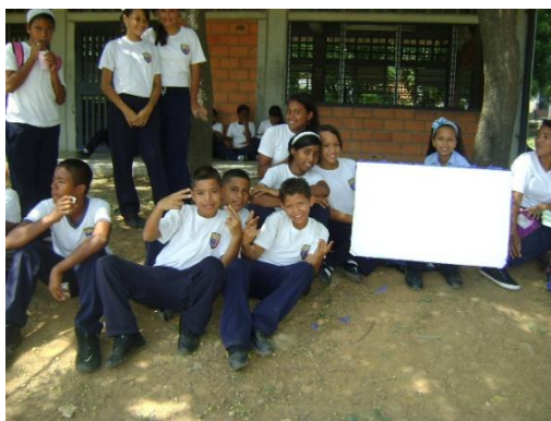
Alumnos 2dos. Años “A” y “B” en dialogo reflexivo