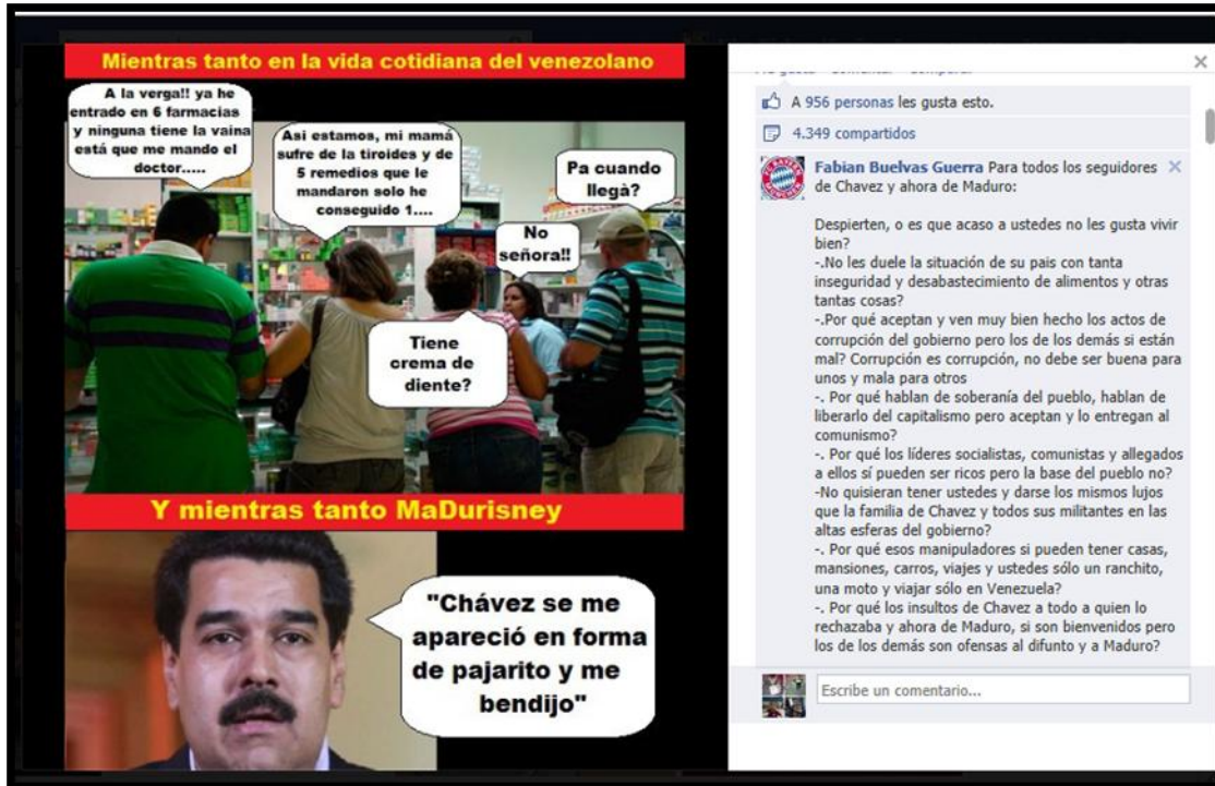
Imagen tomada el 09 de abril del presente año en la cuenta pública Chavezlacagada.