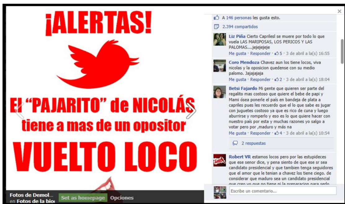
Imagen tomada el día 11 de abril de la cuenta pública "Demolición Roja"