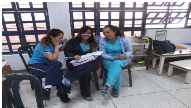
Foto N° 7 Reflexiones: Nuevos Lineamientos de la Educación Especial