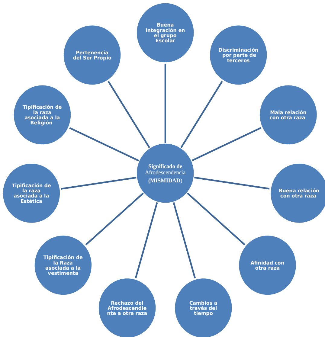
Gráfico 1. Categoría Universal 1. (Elaboración propia de la autora 2014).

Los entrevistados dieron a conocer que para construir un significado propio de la Afrodescendencia se debe partir de los siguientes postulados: