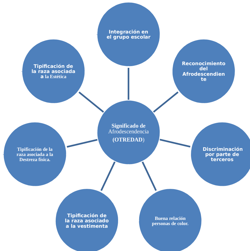
Grafico 2. Categoría Universal 2. (Elaboración propia de la autora 2014).

Categoría Universal 2: Significado de la Afrodescendencia. (OTREDAD). Punto de vista que se da por parte del estudiante NO-Afrodescendiente.