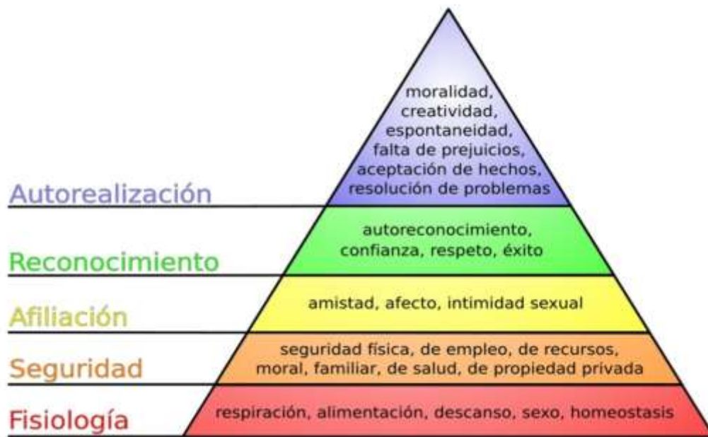
Figura N° 1 Pirámide de las necesidades de Maslow

A continuación, se presenta la pirámide de las necesidades planteada por Maslow: