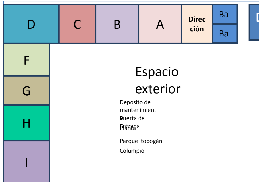
Grafica Nro. (3)