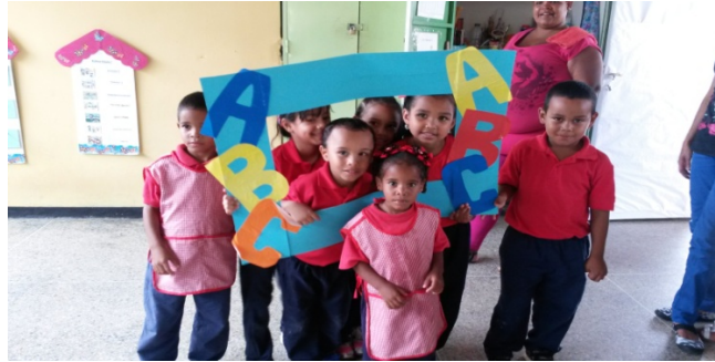
Fotografía Nro. (2)

amistad “te quiero”. Y luego procedieron hacer el intercambio de corazón a su compañero con que se siente más a gusto en su jornada diaria.