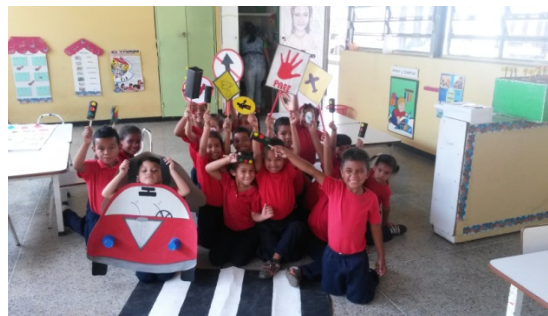
Fotografía Nro. (3)

En el día jueves 28/02/16 de hoy se realizó una pequeña dramatización de las señales de tránsito a los compañeros del C.E.I Bárbula I, en la cual estuvo presente la participación de la practicante. Se relato los hechos de cuando no respetamos el semáforo, la consecuencia que se dan por no cumplir el buen uso del mismo.