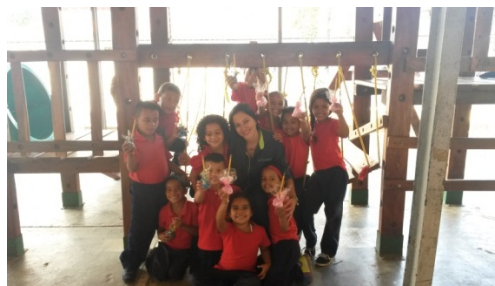
Fotografía Nro. (5)

En el día 17/03/16 los niños y niñas participaron y colaboraron de forma positiva, se tomó en cuenta el comportamiento de cada uno de ellos entre sus compañeros y maestras, esta actividad se desarrolló de la siguiente manera: La docente obtuvo un número que describía una característica de un niño(a) del aula la cual ella tendría que darle el regalo y así sucesivamente se realizó con cada uno de los estudiantes.