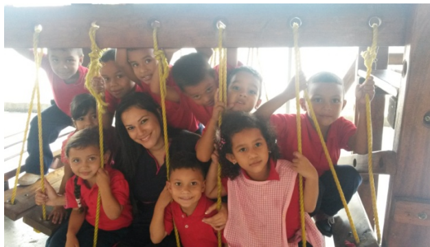
Fotografía Nro. (1)

Día lunes 09/11/15 se les habló del día del abrazo en familia y por que es importante el respeto y amor hacia la familia y los que están día a día en nuestra vida. Se trabajo con la dinámica “El Abrazo” consta en que practicante decía abrazo de uno y se abrazaba un solo niño, cuando se decía abrazo de dos buscaba otro niño (a) para abrazar, así sucesivamente hasta que se hizo el abrazo colectivo incluyendo a la docente de aula. Luego se sentaron los niños en circulo y cada niño(a) le decía una palabra de amor a su compañero.