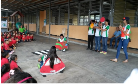
Fotografía Nro. (4)

escoger a un niño del grupo contrario, para que expresará un valor y lo transmitiera con uno de sus compañeros.