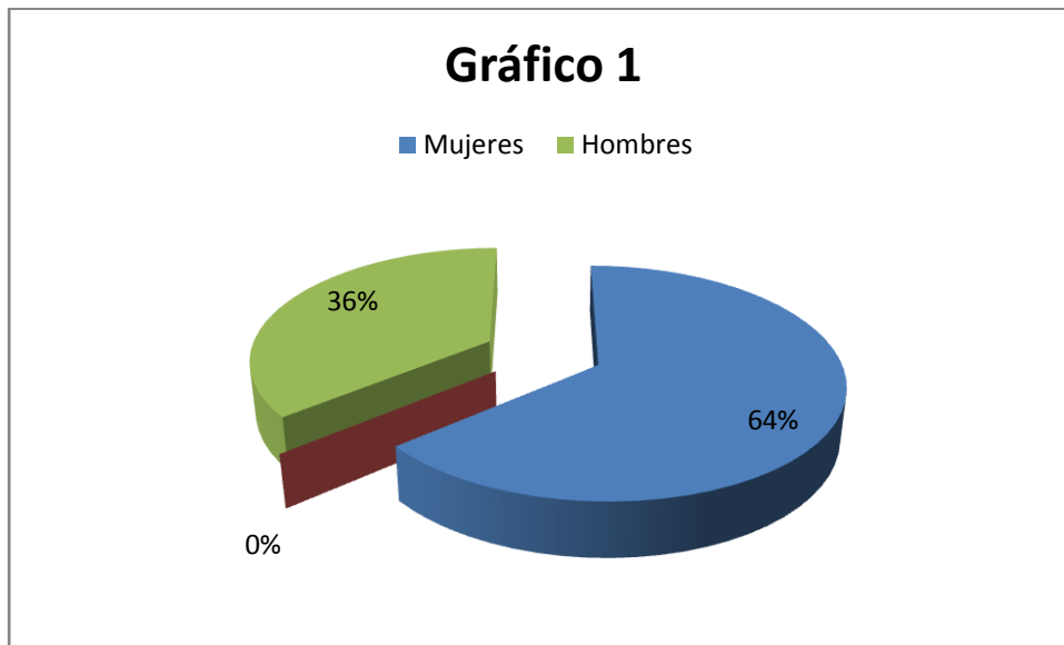
Grafico 1: Distribución de frecuencias y porcentajes de la muestra de personas que asistieron a la consulta al área de odontología del centro asistencial medico integral (C.A.M.I.)