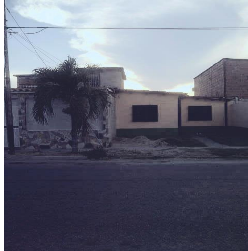
Imagen: casa de la urbanización “El Samán” en su estado original y como les fueron entregadas a sus propietarios.