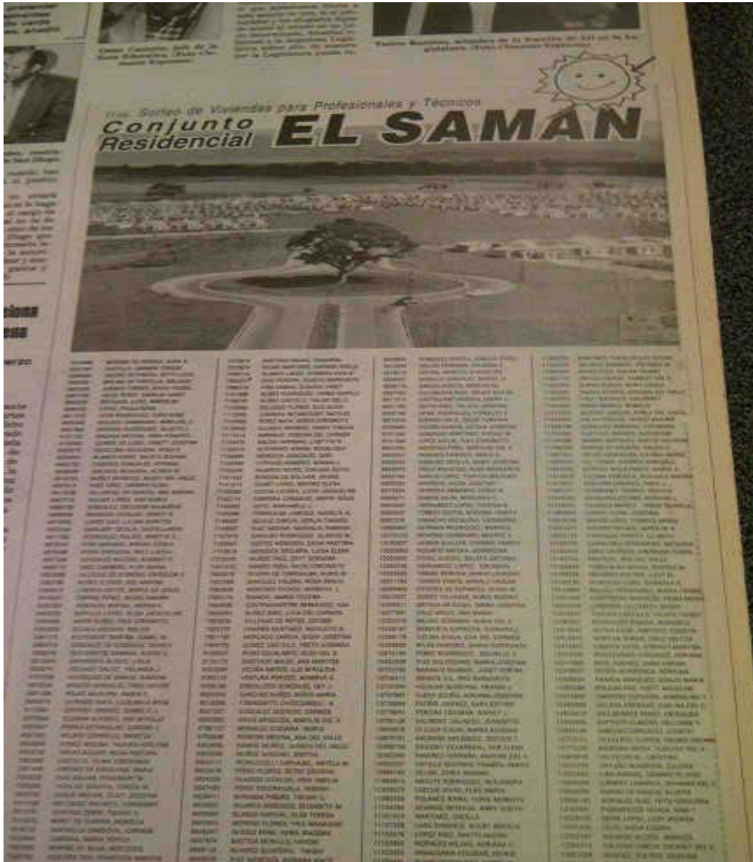
11vo sorteo del Saman, fecha: miércoles 1 de julio 1998 cuerpo A. Pág. 5.

Suministrado: martes 21 de julio del 2015