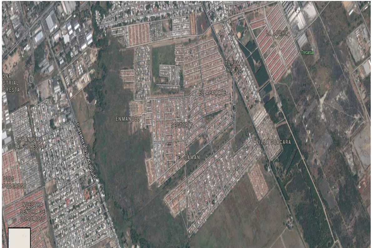
Imagen N° . Imagen satelital poligonal de asentamientos urbanos populares en tierras INTI. Urb. “El Samán”. Guacara Estado Carabobo.