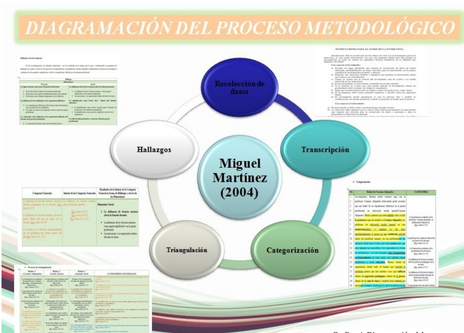
Grafico 4. Diagramación del proceso metodológico. Elaborado por: Ariana Moreno. L