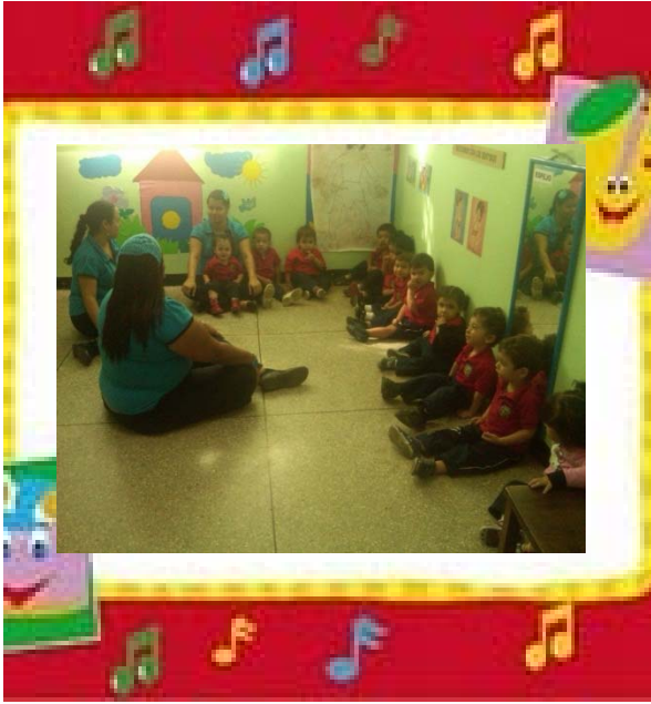
Foto 1. Momento de la ronda de canciones