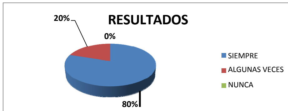
Gráfico 6. Fuente: Rebolledo, K. y Morey, M. (2024)

Fuente: Rebolledo, K. y Morey, M. (2024)